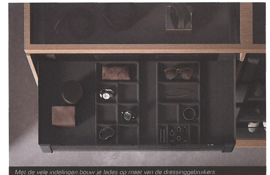
Met de vele indelingen bouw je lades op maat van de dressinggebruikers.