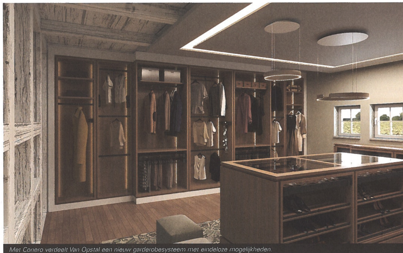
Met Conero verdeelt Van Opstal een nieuw garderobesysteem met eindeloze mogelijkheden.

Tekst: Stephanie Demasure