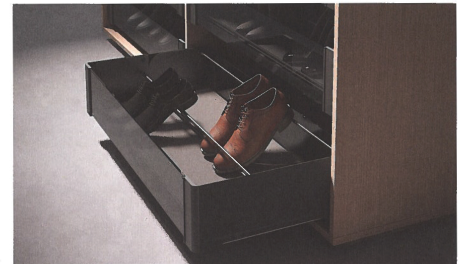
Accessoires in de uittreklades maken de dressing nog overzichtelijker, zoals een schoeninzet.